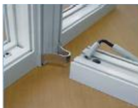
Montage par ressort excentrique