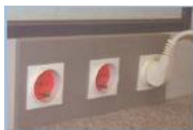
Intégration des équipements électriques